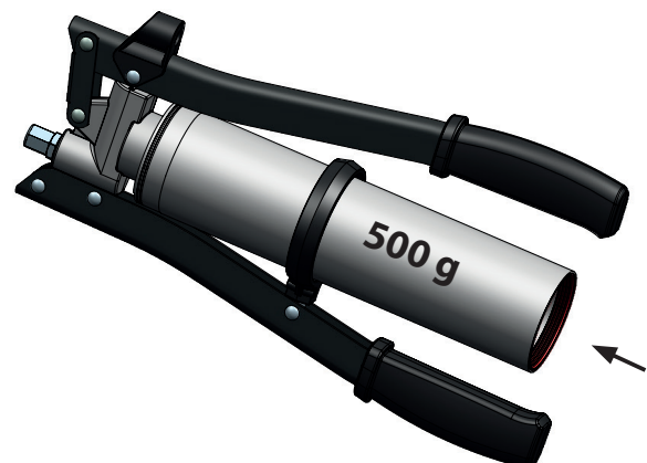
Abb. 8.-1: Betriebsbereitschaft herstellen mit 500 g Schraubkartuschen

Die Fettpresse ist jetzt Betriebsbereit.