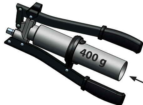
Abb. 8.-2: Betriebsbereitschaft herstellen mit 400 g Schraubkartuschen